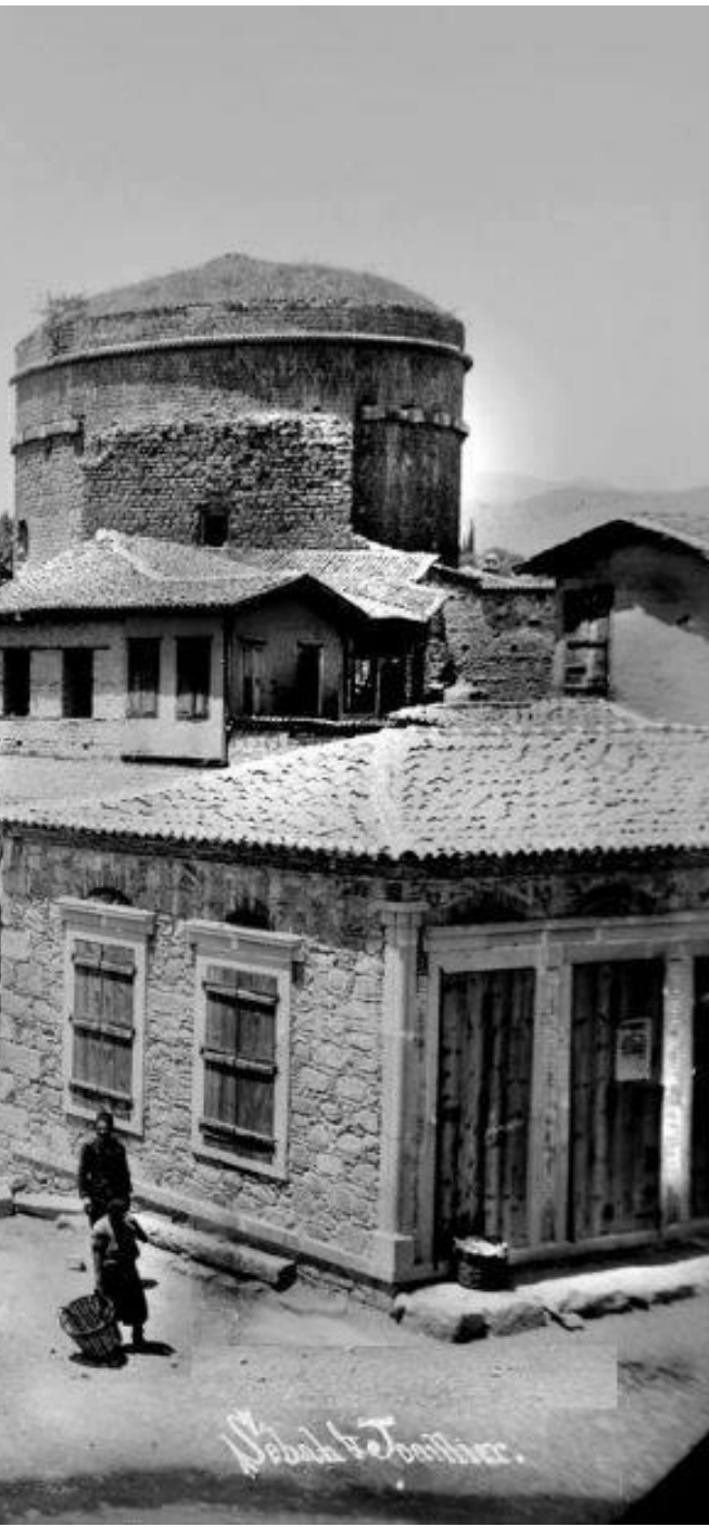
KIZIL AVLU / RED BASILICA, BERGAMA 1908